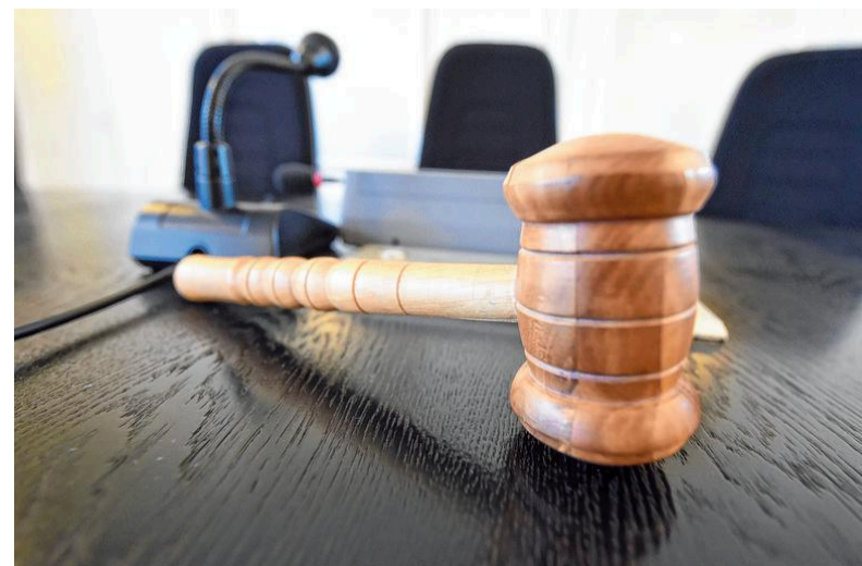
Das Landgericht hat einen 54-Jährigen aus dem Raum Biberach wegen Besitzes und Verbreitung kinderpornografischer Bilddateien zu zwei Jahren auf Bewährung verurteilt. Damit fiel das Urteil milder aus als in erster Instanz, als das Amtsgericht eine Haftstrafe von mehr als zwei Jahren verhängte.

Der Angeklagte verzichtete auf die Einlegung von Rechtsmitteln, die Staatsanwaltschaft prüft, ob sie gegen das Urteil Revision einlegen will.