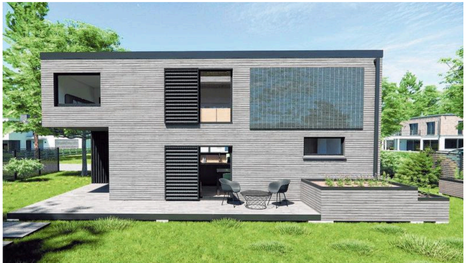
Die Bewohner können sich ihr bewegliches Eigenheim von einem Anbieter ihrer Wahl liefern lassen. Hier ein Anschauungsbeispiel für ein modular aufgebautes Holzhaus.

Schließlich gibt es noch eine weitere Zielgruppe. Die Planer machen eine große Nachfrage aus von Leuten, die etwas für be-