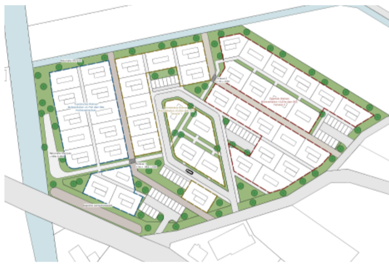
Im Quartier kleiner Wohnen in Ummendorf sind drei Zonen angedacht. Neben Wohnen im Eigentum und vermietetem Wohnen sehen die Planer Wohnen auf Zeit vor. Das trifft es besser als der Begriff touristisches Wohnen aus der Entwurfskizze. GRAFIC: DR. HUCHLER + PARTNER

dacht. In der Skizze sind die Einheiten für „Wohnen auf Zeit“ zur Umlach hin gruppiert. Freilich sind die Zahlen und Abgrenzungen aus dem Entwurf nicht verbindlich. Der zweite Teilbereich in der Mitte ist für „vermietetes Wohnen“ vorgesehen. Darunter ist eine Miete oder Nutzungsgebühr für den Standort zu verstehen. Die Idee ist, dass hier Leute ihr bewegliches Holzhäuschen auf Dauer bewohnen und erwerben, aber nicht den Grund und Boden – immerhin auch eine Finanzierungsfrage. Im dritten